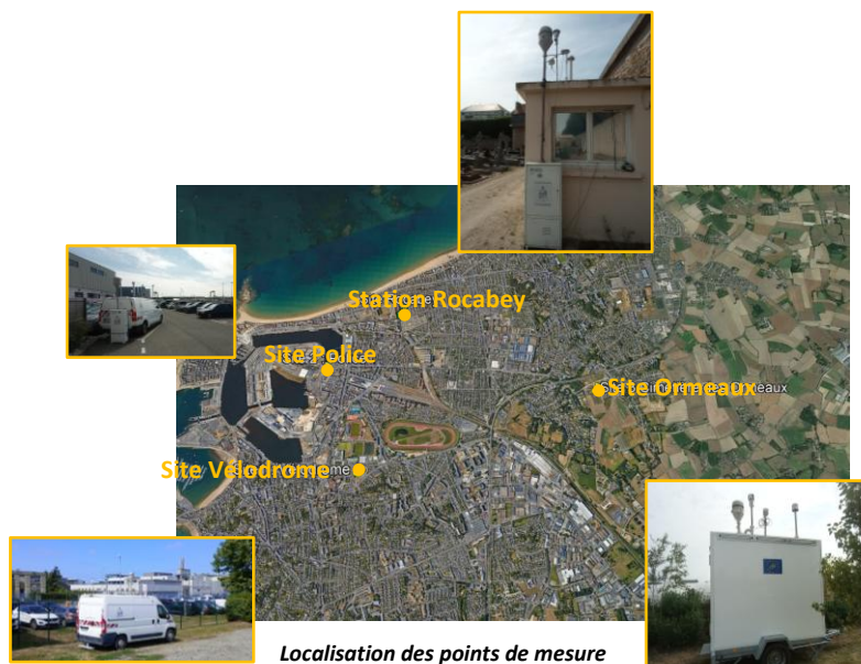
Localisation des points de mesure