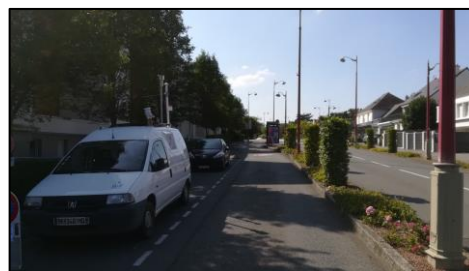
Site de mesure urbain trafic : rue de Rennes