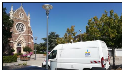
Site de mesure urbain de fond : place de l'église

Ces polluants sont réglementés en France en raison de leurs effets délétères lorsqu'ils sont présents en trop forte concentration.