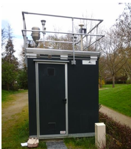
Site de mesures Pays Bas à Rennes

Ces prélèvements sont réalisés conformément à la norme NF EN 15549 (2008).